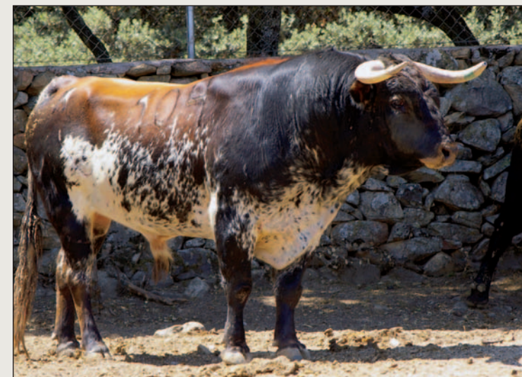
Bonito el utrero de Torrenueva, número 104.