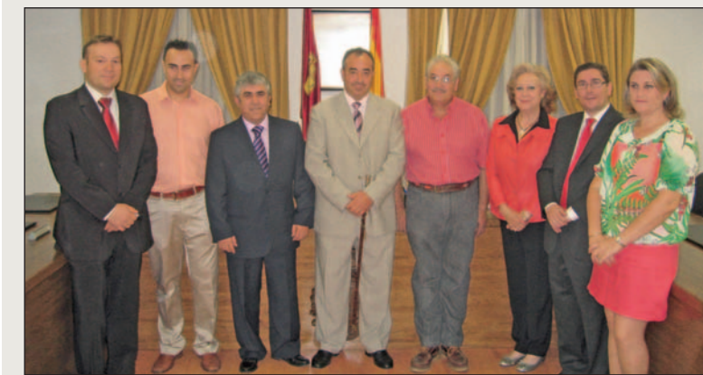
Foto de familia tras la aprobación en sesión plenaria de la Fiesta como BIC.

De la cartelera, como no podía ser de otro manera, destacan varios nombres del escalafón de plata. "Son carteles muy rematados, bonitos y con interés, sobre todo el mano a mano con el que se cerrará la feria entre Víctor Barrio y López Simón, dos de los novilleros punteros. También destaca la presencia de Sergio Flores, revelación del año y que