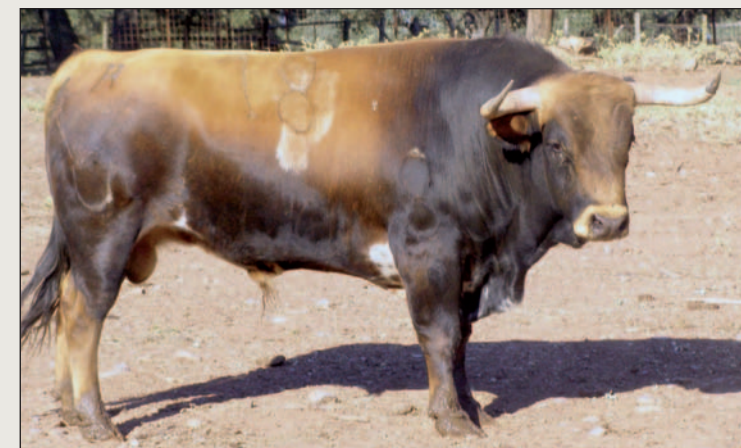
Número 18, de Navalrosal, ganadería triunfadora el pasado año.