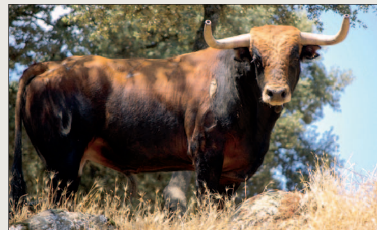
Ejemplar de Montealto, número 29, reseñado para Villaseca de la Sagra.